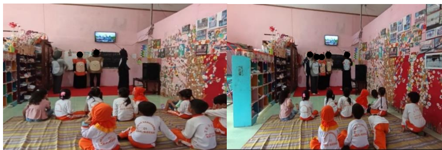
Gambar 1. Pertunjukan Drama “Cintai Tubuhmu”