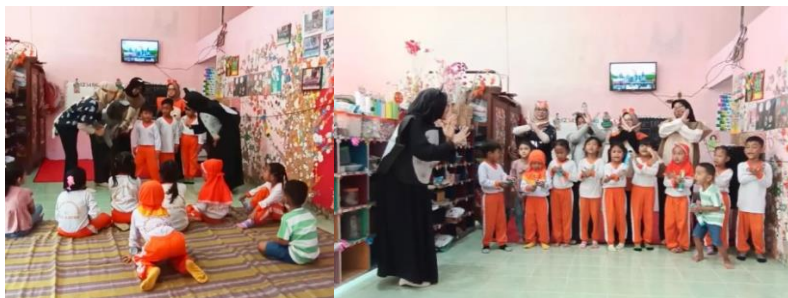
Gambar 2. Diskusi dan Tanya Jawab

Setelah pertunjukan usai, tim pelaksana melakukan observasi terhadap perubahan sikap anak-anak. Terlihat bahwa mereka lebih berani dalam mengungkapkan pendapat dan mulai mengenal istilah-istilah seperti “bagian pribadi”, “tidak nyaman”, dan “lapor ke guru atau orang tua”. Diskusi informal dengan guru mengungkapkan bahwa kegiatan ini memberi dampak positif. Anak-anak menjadi lebih terbuka dalam bertanya tentang tubuh dan menunjukkan sikap waspada terhadap interaksi fisik yang tidak diinginkan. Beberapa guru bahkan menyampaikan bahwa anak-anak mengulangi gerakan dan kalimat dari drama saat bermain, sebagai bentuk internalisasi dari pembelajaran yang diterima.